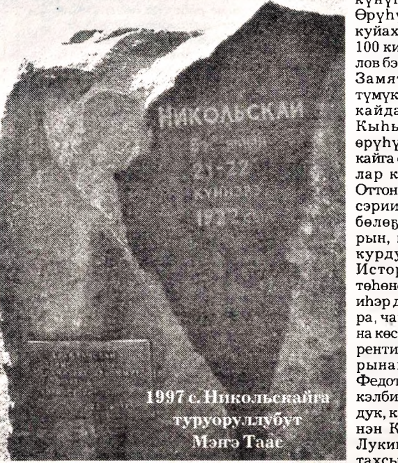
1997 с. Никольскайга туруоруллубут Мэнгэ Таае